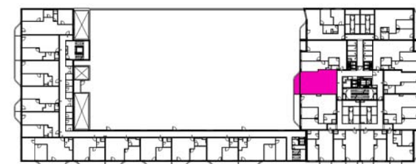
schéma pôdorysu 5. NP / scheme of the fifth floor